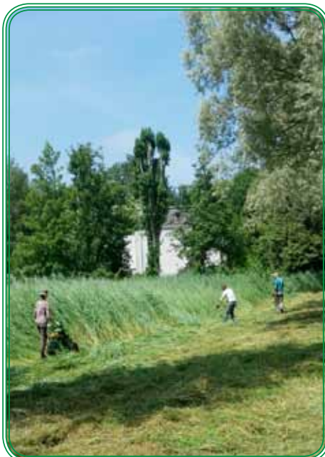
Maaierwerk op De Tol