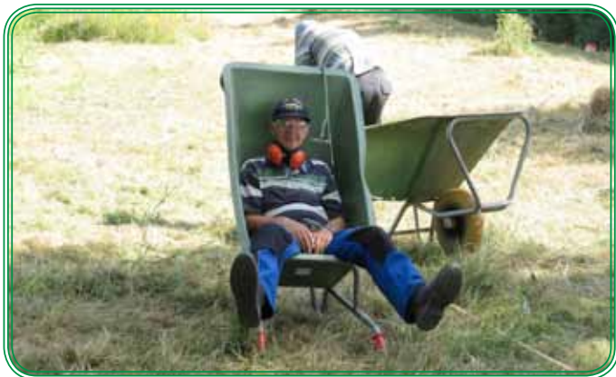
Na hard werken is het goed....?