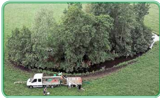
Afvoer van hout uit geriefbosje