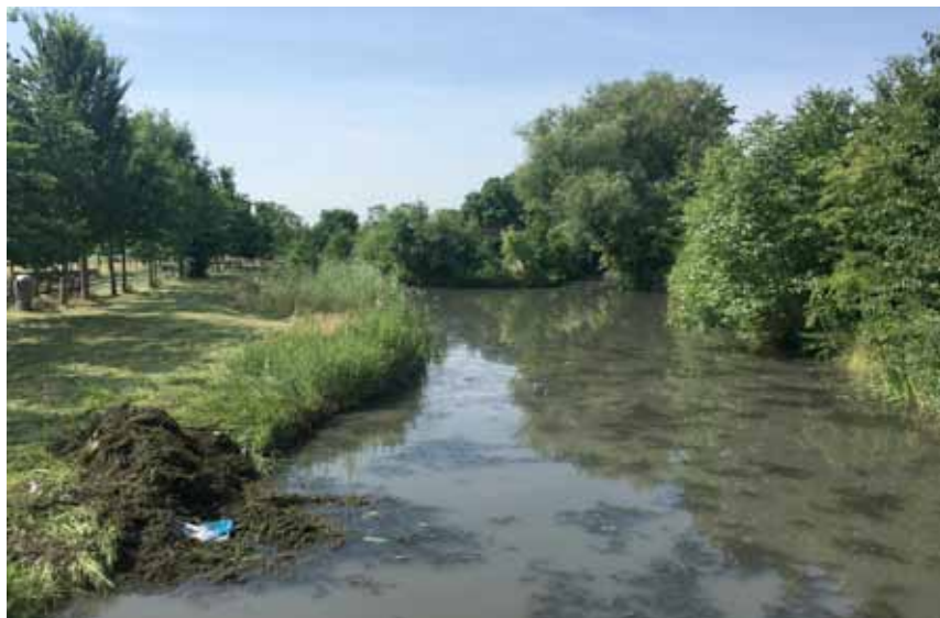
De Enghwetering bij de Buitenplaats

Donderdag 24 mei is met 7 personen hout weggehaald bij Vlooswijk en iedereen vond het fijn dat ook Marlies meeding om in het veld te helpen met hout slepen en over de sloten gooien.