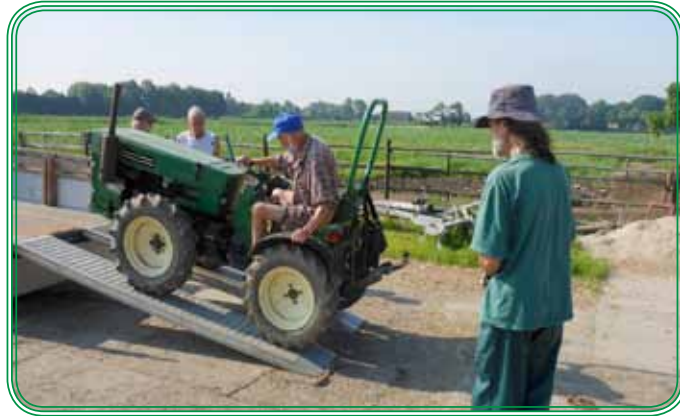
De Rucker werd ingezet