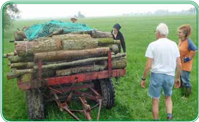
Afvoer hout bij Huiden