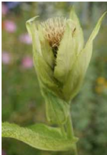
Schotelvormige omhulling van het bloemhoofdje

Waarschijnlijk is de afhankelijkheid van kruisbestuiving er de oorzaak van dat het niet tot blijvende areaal-uitbreiding leidt. Daarvoor zijn dan minstens twee vestigingen binnen elkaars bestuivingsbereik nodig.