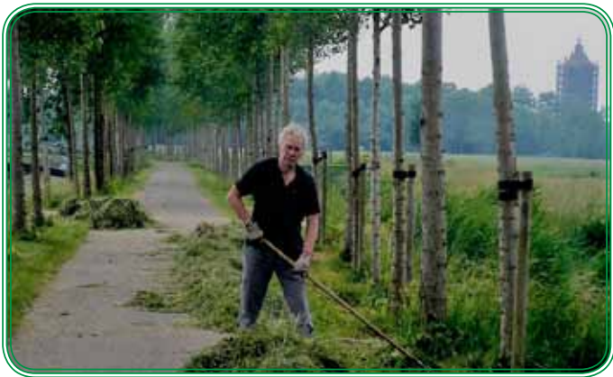
Afharken in de Joostenlaan