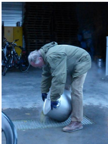
Tabé giet af...

Als de boerenkooldag op 9 november j.l. een voorbode is van het komende winterseizoen, dan belooft het een heel goed jaar te worden: een grote opkomst, een enorme bedrijvigheid, een heerlijke boerenkoolmaaltijd, geserveerd door Tabé en zó'n grote houtopbrengst van de elzenhaag tegenover de Buitenplaats, dat zelfs Rucker de aanhanger niet meer kon trekken. De bedrijvigheid bestond niet alleen uit zagen en sjouwen. Kasten werden in elkaar gezet, de verlichting van de nieuwe keet gerepareerd, motorzagen geslepen en boerenkool gestampt.