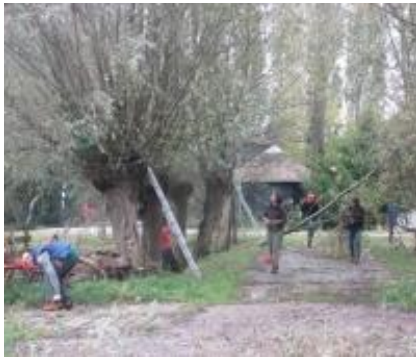
De laatste wilgen.....

Dankzij het meegenomen droge aanmaakhout brandde er echter weldra een behoorlijk knotvuur. De groentesoep van Anne ging bij de lunch met veel smaak naar binnen. Bij de Buitenplaats bleek intussen weer een behoorlijke hoeveelheid hout uit Amelisseweerd gedumpt te zijn. En die is zeer welkom !