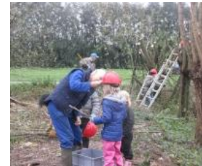
Ad aan het passen....