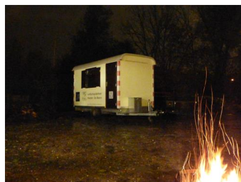
de nieuwe keet in sfeervolle ambiance....

Hans is een tijd uit de running geweest maar als herboren teruggekeerd. Hij is iemand die graag achter de schermen werkt, zonder poespas, maar ondertussen bergen werk verzet.