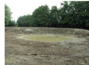
een ecologische 0-situatie ►►

'Een inventarisatie van de ecologische nulsituatie in de Buitenhof, Leidsche Rijn, te Utrecht'.