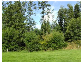
geriefbosje te Achthoven

De boer als natuurbeheerder ondersteunen is op op z'n zachtst gezegd volstrekt inefficiënt gebleken.