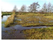
De Kievit in Harmelen

Waterschappen en recreatieschappen hebben een taak in het natuurbeheer. Ze worden gefinancierd door de gemeenschap. Waterschappen zijn verantwoordelijk voor de waterkwaliteit van het oppervlaktewater en de waterpeilen.