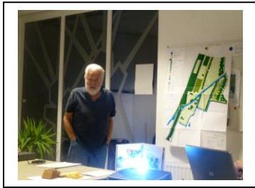
Reint voor een kaart van de Buitenhof.

zich zullen willen inzetten voor deze bijzondere locaties wat betreft flora ( en fauna ).