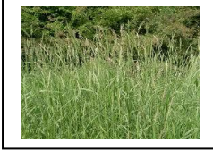
Rietgras ( Phalaris arundinacea) Rietgras is een hoog oevergras, dat op de manier van riet groeit en daar in niet bloeiende toestand zeer veel op lijkt.

Ook 2012 was een te nat jaar om hier goed op in te kunnen springen. Er zit niets anders op dan de geduide plekken met riet en rietgras in 2013 extra in mei te maaien.