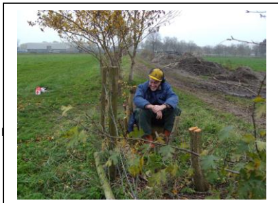
Ad heeft het wel gehad na weer een dag meidoorn. Even wat relaxen voor de boerenkool straks.

Op de zogenaamde boerenkooldag vieren we de officiële opening van het knotseizoen (hoewel we vaak al vele weken eerder met het winterprogramma begonnen zijn ). Dit jaar was het een grijze dag met af en toe wat (mot)regen. Gelukkig was het vuur (van de dag ervoor) weer snel opgepoord. Er werd hard door 13 knotters, die de, één na de ander, in de loop van de dag arriveerden, gewerkt. Prima, dat er ook 3 gasten kwamen, die zich ontfermden over een paar knotwilgen. Een flink deel van de meidoornhaag werd teruggezet; een lastige klus vanwege het "warrige" takkenstelsel.