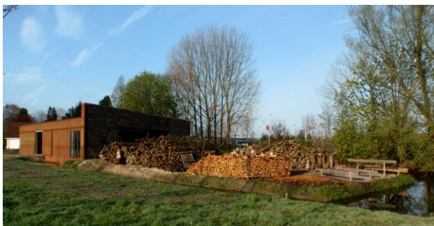
De Buitenplaats voorjaar 2012